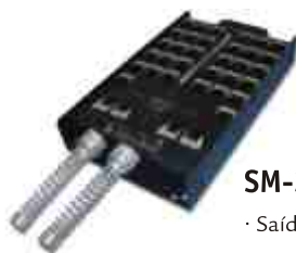
SM-36C · Saídas para 32 + 4 canais