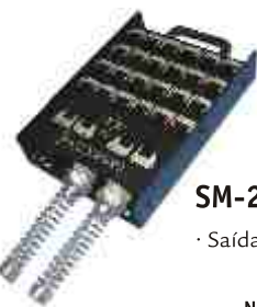
SM-28C · Saídas para 24 + 4 canais