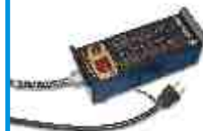
FL-6000 Inclui os componentes elétricos, exceto o cabeamento e a instalação.