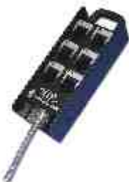
SM-6C · Saídas para 6 canais