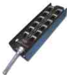
SM-12C · Saídas para 12 canais