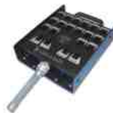
SM-20C · Saídas para 16 + 4 canais