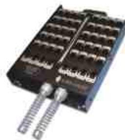
SM-48C · Saídas para 40 + 8 canais

Nos modelos SM-28C, SM-36C e SM-48C o segundo prensa cabo é adquirido como acessório