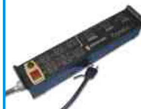
FL-9000 Inclui os componentes elétricos, exceto o cabeamento e a instalação.